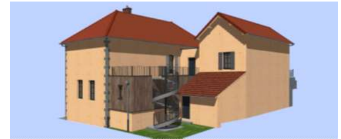
Projet final vue Sud-Ouest