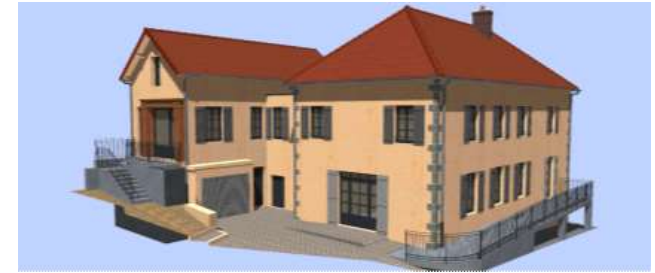
Projet final vue Nord-Est